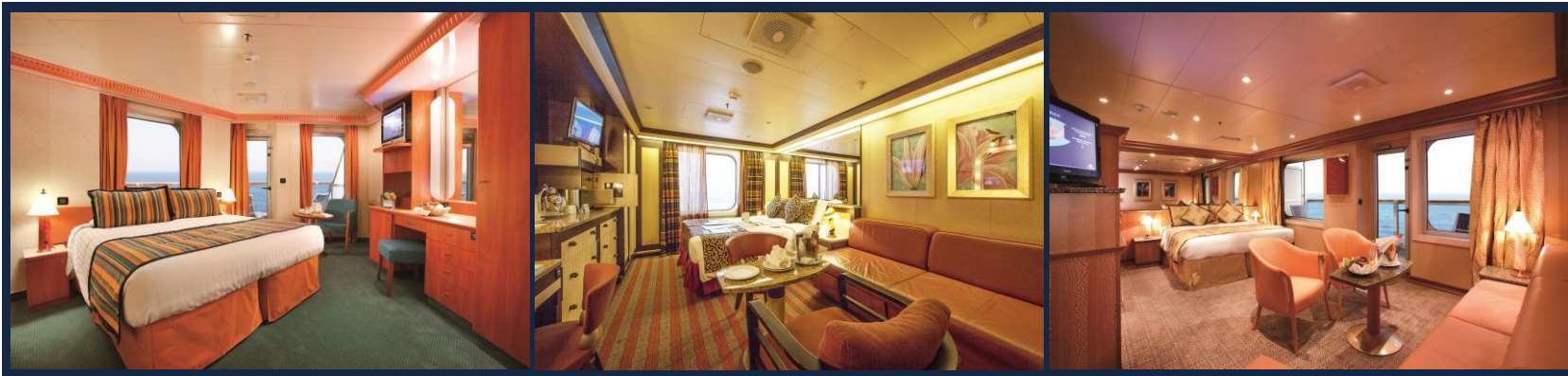
미니 스위트 객실