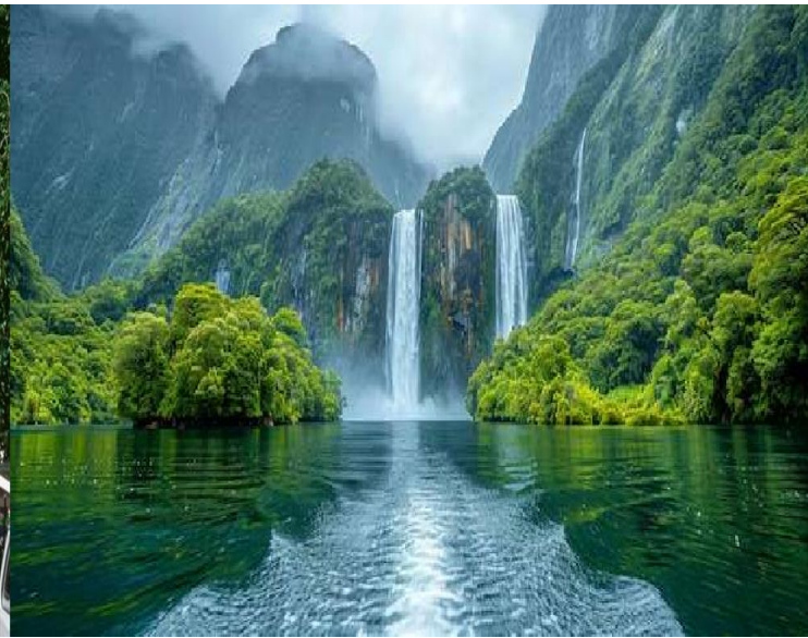
뉴질랜드 밀포드 사운드

뉴질랜드의 크라이스트처치는 '정원의 도시'라고 불릴 만큼 도시 중심에 아름다운 식물원이 위치해 있고, 에이번강이 도시를 가로지르며 흐르고 있어, 현지인과 관광객 모두에게 인기 있는 휴양지이다. 또한, 크라이스트처치 대성당과 같은 고딕 양식의 건축물이 있어 역사적 유산을 엿볼 수 있고, 거리 예술이 도시 전역에 흩어져 있어 예술 애호가들에게 흥미로운 볼거리를 제공한다.