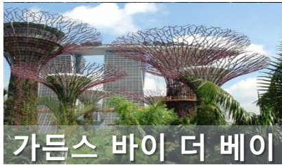
가든스 바이 더 베이

싱가포르의 상징인 멀라이언상(Merlion Statue)이 있는 공원입니다. 멀라이언상은 8.6m 거대한 크기로 공원의 한가운데에 자리 잡고 있는데, 뒤로는 풀러턴 호텔(The Fullerton Hotel)이 있고 앞으로는 마리나 베이를 마주하고 있습니다. 사자의 머리에 물고기의 몸체를 가지고 있는 멀라이언은 바다를 뜻하는 'Mer'와 산스크리트어로 'Singa'로 해석되는 'lion'이 합쳐진 이름입니다